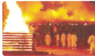
満点の迫力!『若草山麓』