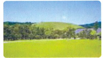
若草山を一望! 『浮雲園地』『春日野園地』

※若草山焼き鑑賞の際は、近隣住民の皆さまのご迷惑とならないよう、マナーを守ってください。