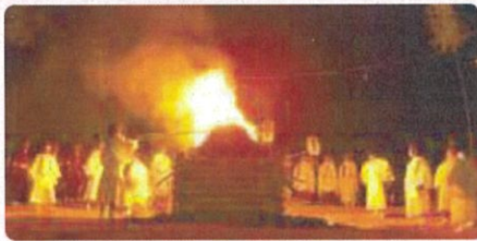
山麓中央大かがり火