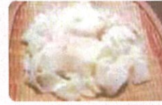
春日大社の「はくたくうどん」

若草山焼きとゆかりの深い春日大社、興福寺、東大寺。この三社寺より伝統的に継承されてきた食を再現してご提供します。食を通じて、奈良の伝統に触れてください。